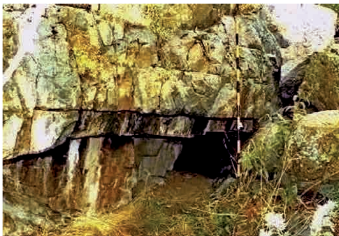
Рис. 8. Ущелье Ерменсай. «Пещера Нечухранныго А.М.».

Однако ночь, проведенная в этой пещере, поставила и некоторые вопросы, на которые нет ответа. Например, было непонятно, как Б.Н. Дублицкий мог планировать на будущий год углубить раскоп близ захоронения, если пещера, в которой довелось ночевать, была сплошь каменная? Этот и другие вопросы не состыковывались с тем, что доводилось слышать от людей и что удалось увидеть. Однако это была единственная пещера ущелья Ерменсай.