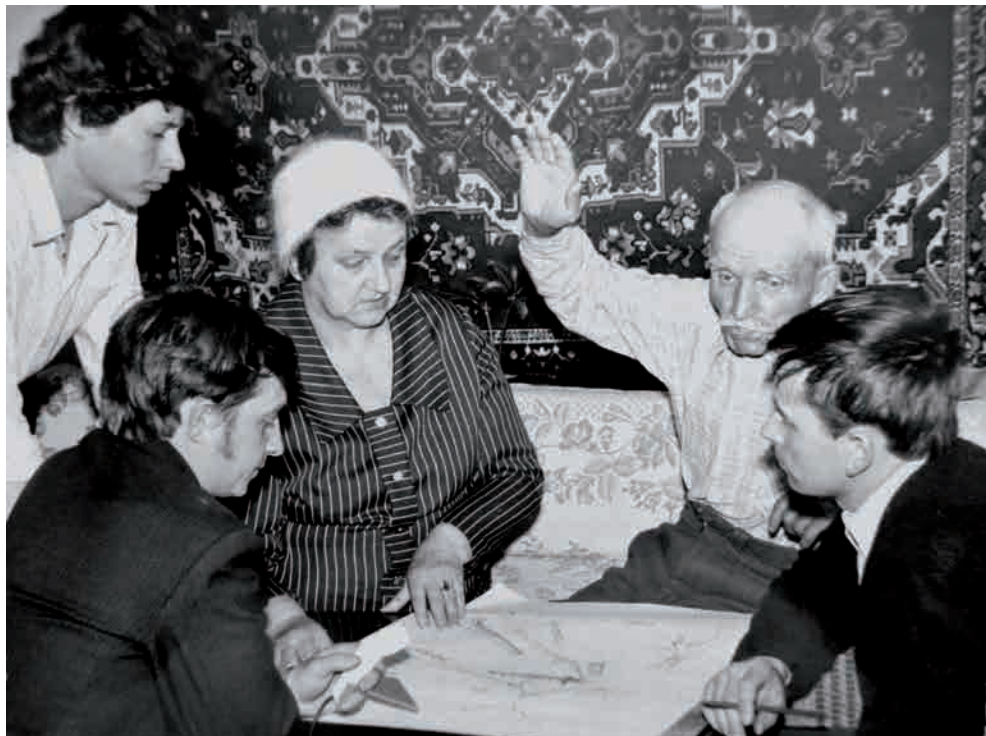
Рис. 3. Запись рассказа К.П. Бирюкова о прошлом пос. Фабричный.